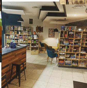
Bar du Chifoumi