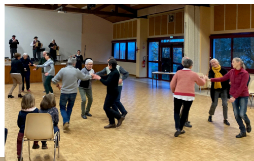
Avant deux de Couffé