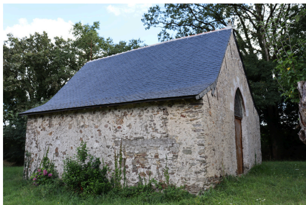
Réfection de la toiture de la chapelle Saint-Symphorien