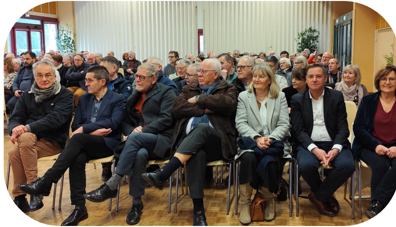
Élus des communes environnantes, député et conseillers départementaux étaient présents à la cérémonie