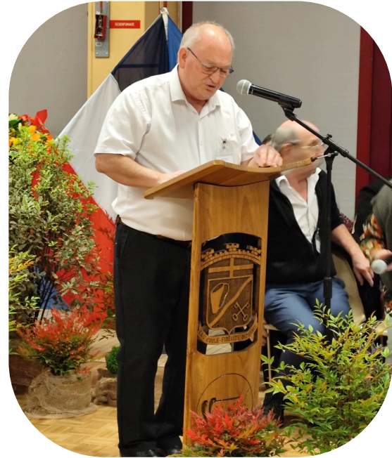
Le Maire a ouvert la cérémonie