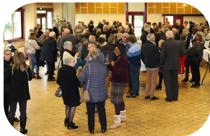
Le verre de l'amitié a clôturé la cérémonie