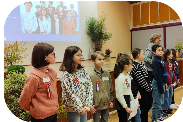
Les enfants du Conseil Communal des Enfants ont présenté leurs actions